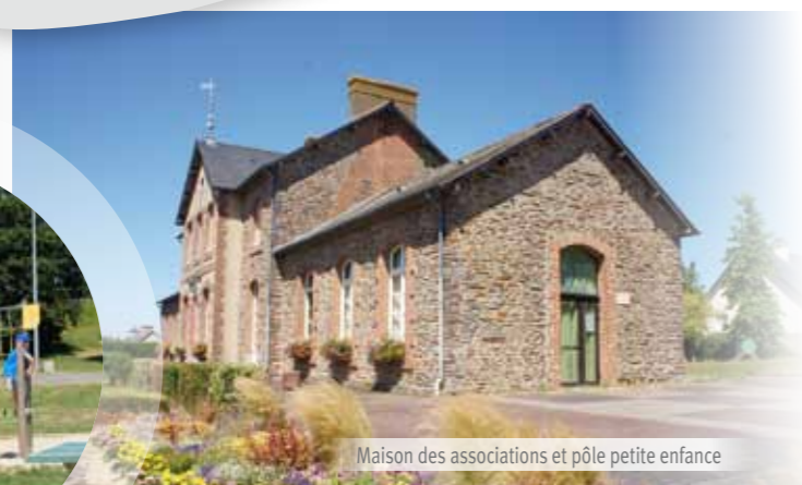
Maison des associations et pôle petite enfance